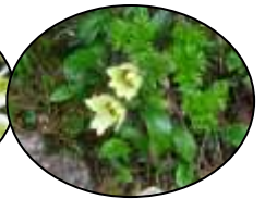
イワウメ ツクモグサ