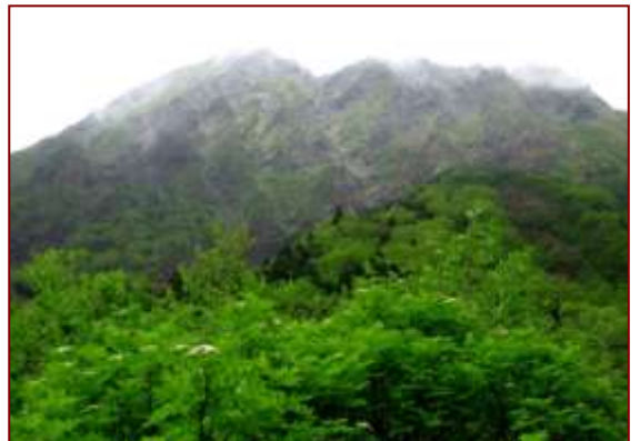
赤岳から下山、振り返ると赤岳山頂が霧に見え隠れする。PM12:30 行者小屋で昼食。南沢を下り、美濃戸を経て松本へ