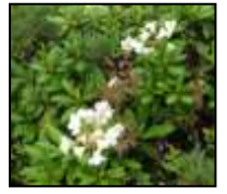
ハクサンイチゲ キバナジャクナゲ