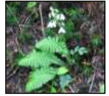
ベニバナヘビイチゴ オサバグサ