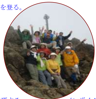
AM7:30 横岳山頂 2835mに登頂。濃霧の中、AM9:45 主峰赤岳 2899mに登頂する。