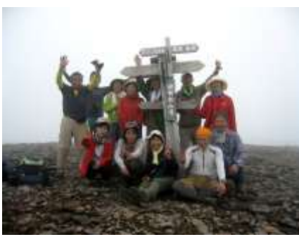
AM12:00 赤岩の頭に登り出る。PM12:30 霧の硫黄岳 2765mに登頂。