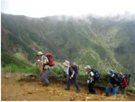
7/2AM8:00、曇天の美濃戸を出発。赤岳鉱泉からの森林帯で鹿に出会う。