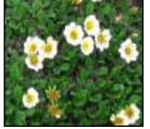
ウルップソウ チョウノスケソウ