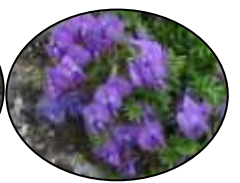
イワカガミ オヤマノエンドウ