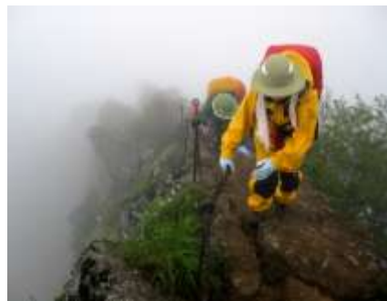
道標のケルンが積まれた硫黄岳。7/3AM6:30 濃霧の山荘を出発。横岳の岩場を登る。