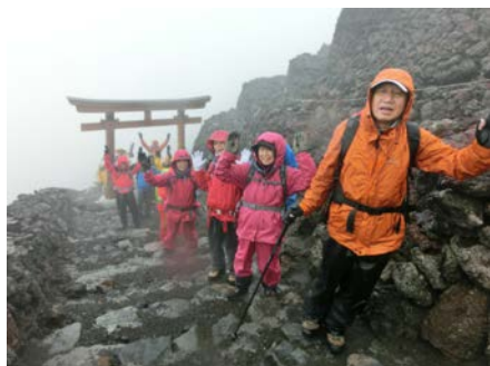
山頂直下の大鳥居

信濃毎日新聞社、朝日新聞松本支局、毎日新聞松本支局、読売新聞松本支局、産経新聞長野支局、 中日新聞社、市民タイムス、MGプレス、長野日報社、SBC 信越放送、NBS 長野放送、TSB テレビ信州、 abn 長野朝日放送、テレビ松本ケーブルビジョン、FM 長野、長野県写真連盟