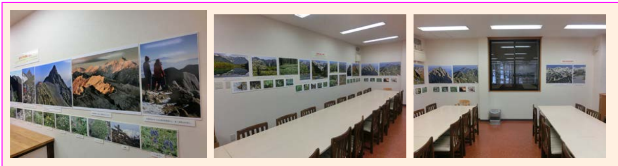
上高地バスターミナル 2F 室特設会場

※是非ご来場下さい。パネル写真 A2 版の売上は、国際協力基金に積み立てられ、MHC 奨学金支給及びヒラリースクール・クムジュン校学生寮運営資金に使われます。