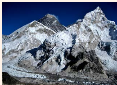
2018.1 エベレスト撮影紀行Ⅶ