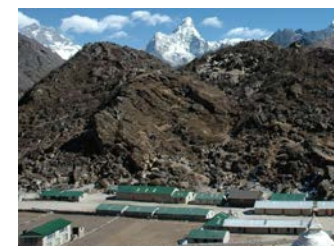
クムジュン校中央建物 2 棟が MHC 学生寮