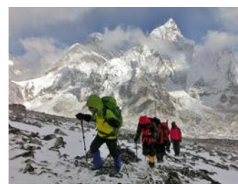
カラパタールを目指して