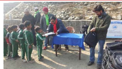
学校へ教育資材提供