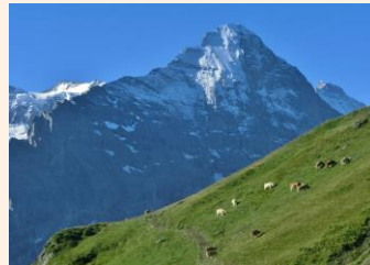
アイガーと放牧牛